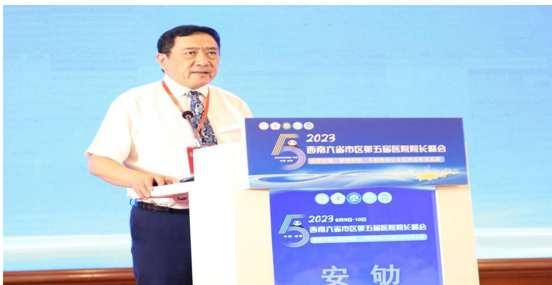
四川省医院协会安劬会长致欢迎辞