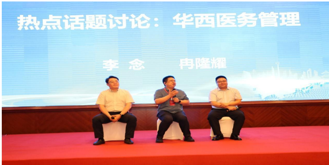
华西医院医务管理热点话题讨论交流