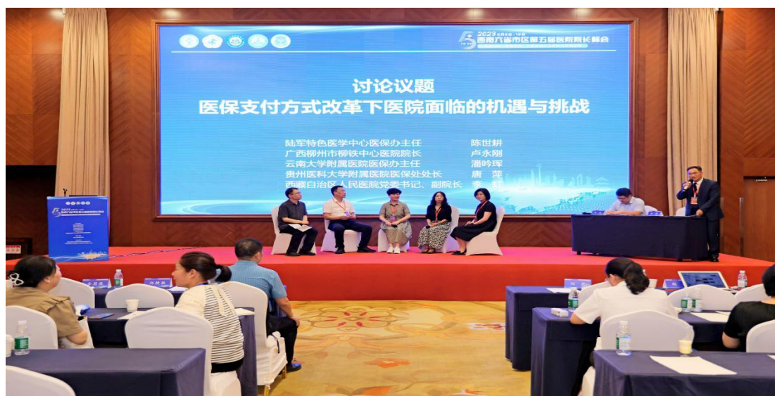
医院医保管理分会场开展 《医保支付方式改革下医院面临的机遇与挑战》专题讨论