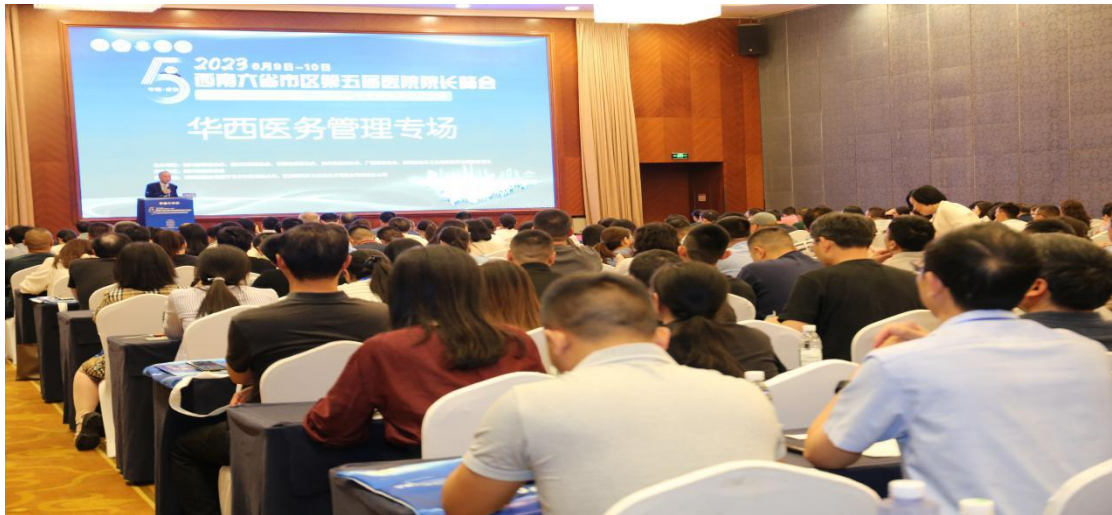
华西医院医务管理专场