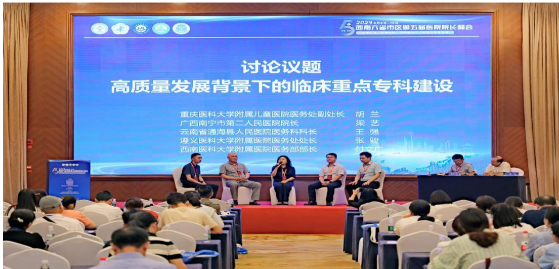
医务管理与质量控制分会场开展 《高质量发展背景下的临床重点专科建设》专题讨论