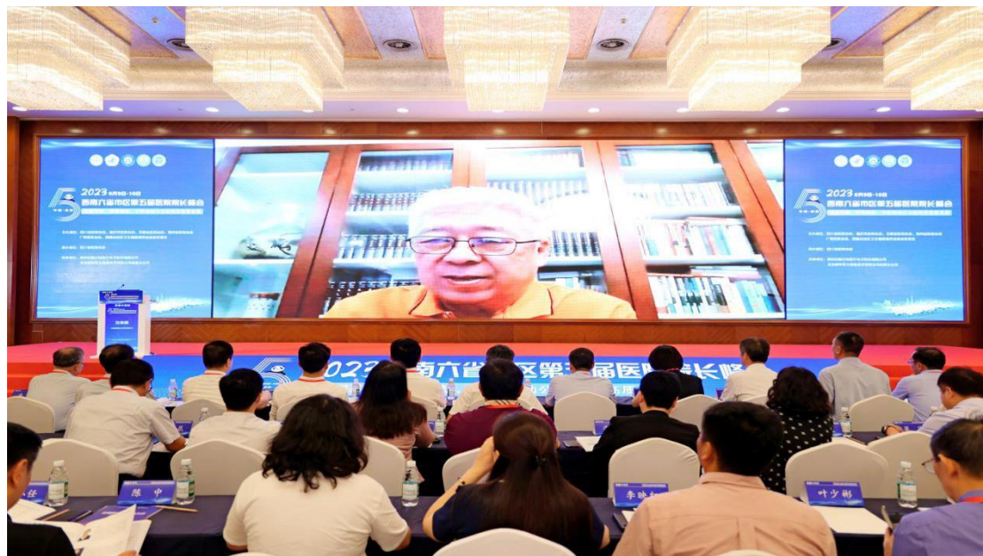
中国医院协会常务副会长方来英视频讲话